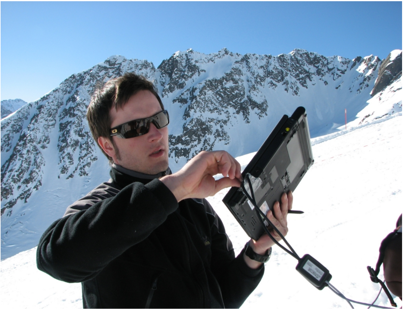
Feldtest_Bindung_PC (Bild 1 von 5) » Vorwärts